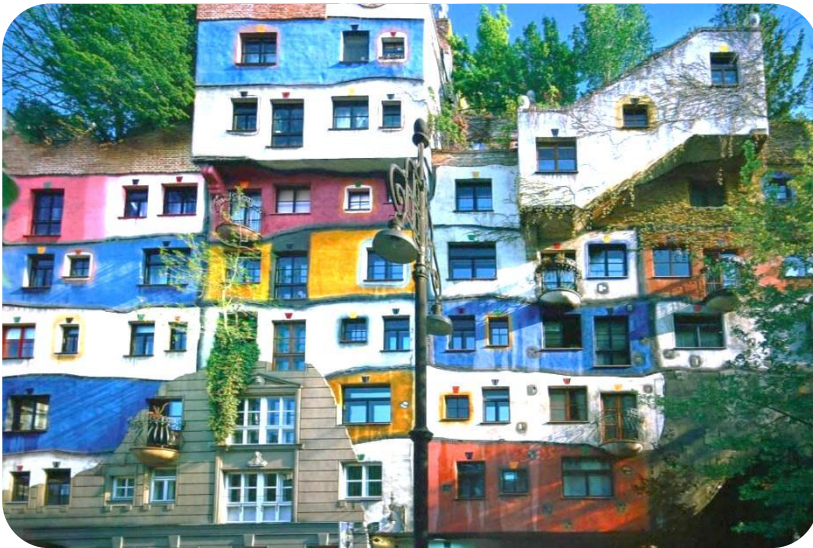
Maison de Hundertwasser (1977)

La maison de Hundertwasser à Vienne (créée en 1977) et la gare de Uelzen en Allemagne (rénovée en 2000), montrent toute l'inventivité de Hundertwasser et sont représentatives de son art.