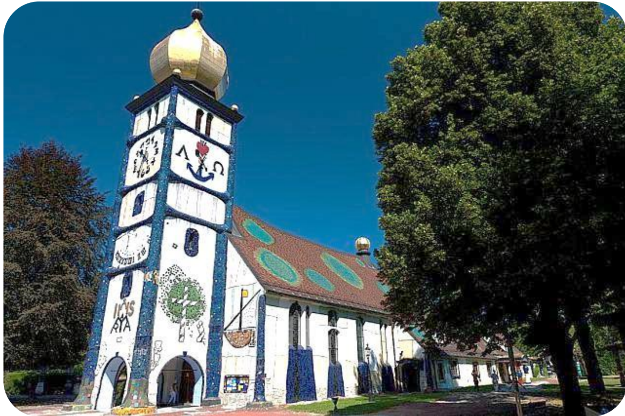
Die Sankt Barbara Kirche (Eglise Sainte Barbe à Bärnbach – Autriche)