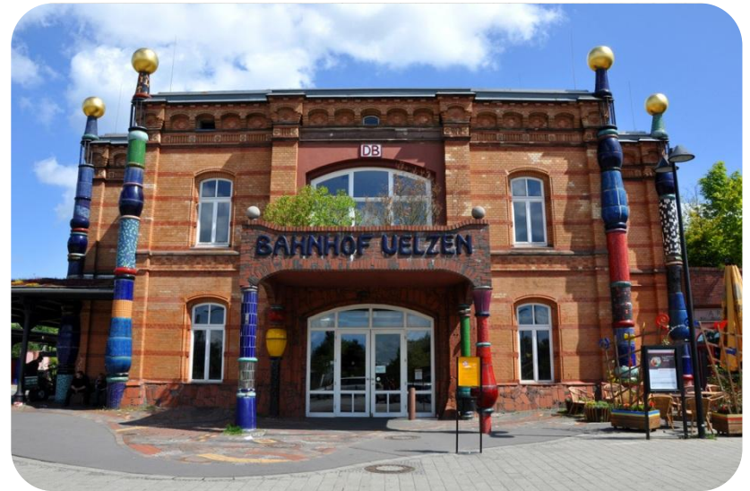
Gare de Uelzen (2000)