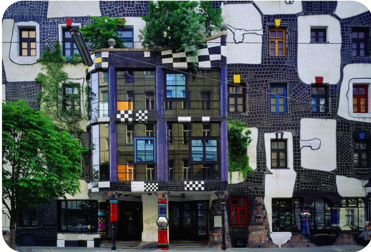
Kunsthau Wien (Musée Hundertwasser à Vienne)