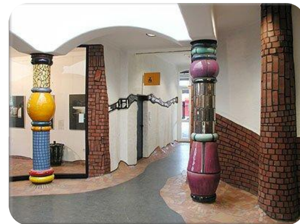
Intérieur de la gare de Uelzen