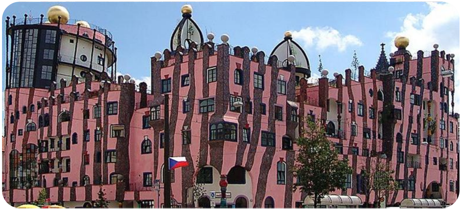
Die grüne Zitadelle (La citadelle verte à Magdebourg – Allemagne)