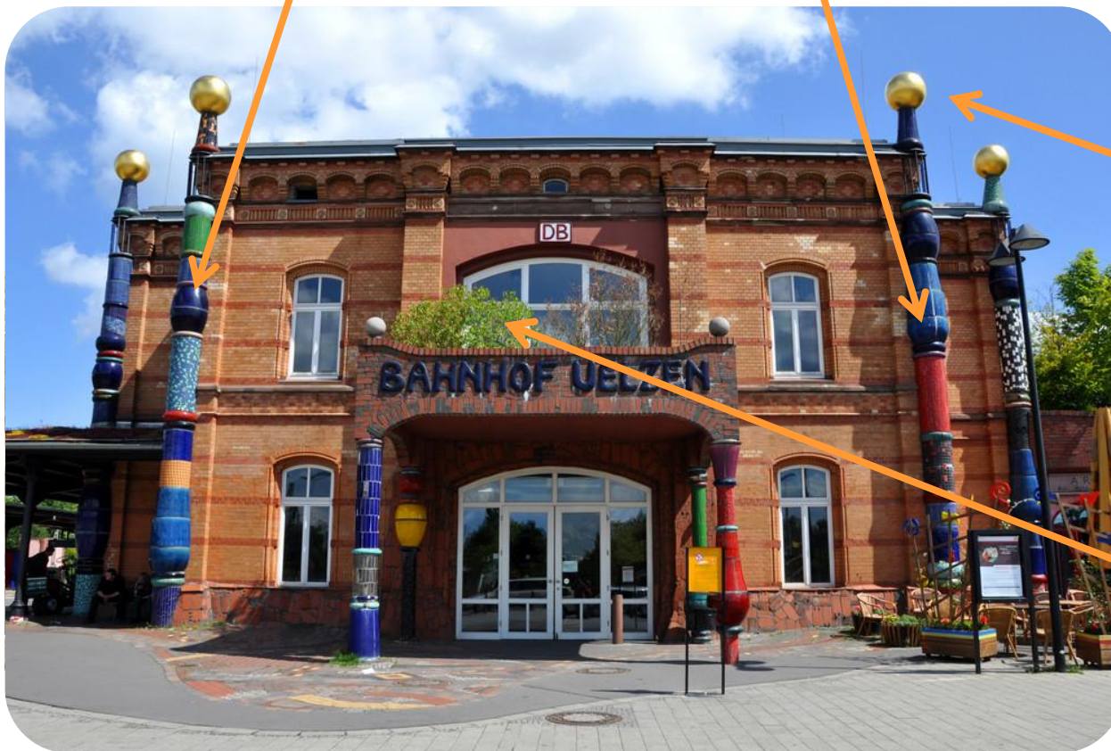
Gare de Uelzen (2000)

Balcons ornés d'arbres, de fleurs et de plantes