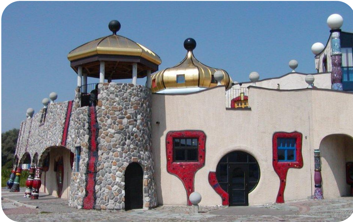
Markthalle (Halle du marché à Altenrhein – Suisse)