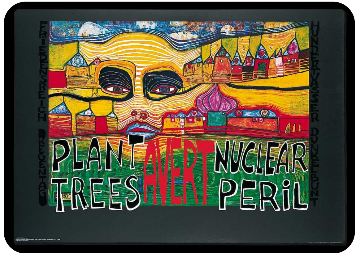
Affiche contre le nucléaire (1980) (Plantez des arbres pour éviter le péril nucléaire)

Tout au long de sa vie il s'est engagé pour la protection de l'environnement. Il a été un farouche opposant à l'énergie nucléaire et a vivement dénoncé la pollution des mers et des forêts. Ce message très écologique transparaît très clairement dans de nombreuses affiches créées dans les années 80.