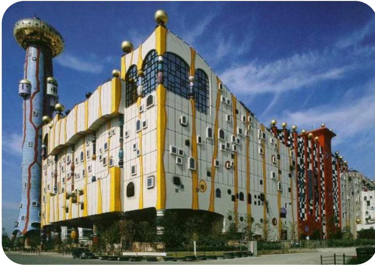
Usine d'incinérateur de déchets à Osaka (Japon)