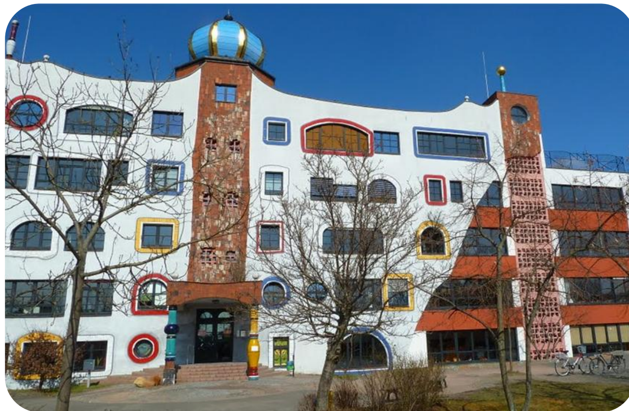
Martin-Luther Gymnasium (Lycée de Wittenberg - Allemagne)